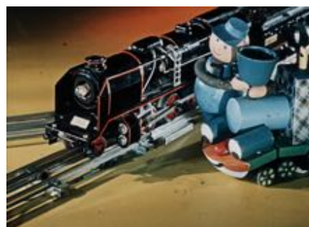
L'Aventure de minuit