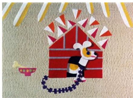
Le Chien sans peur