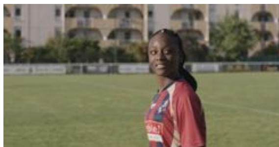
Numéro 10, Prix Collège au cinéma 2021