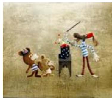
Blaise, le balaise !

Mardi 01/02 – 10h45 – Gaumont Jedi 03/02 – 9h30 – Gaumont